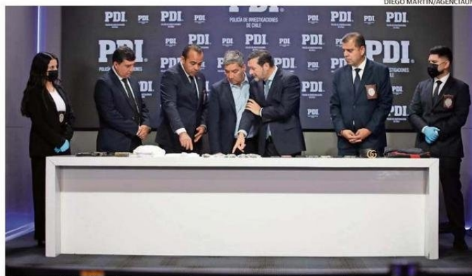
En el operativo les incautaron armas y drogas como metanfetamina y cocaína.

Los detectives dieron con los seis integrantes de la banda,