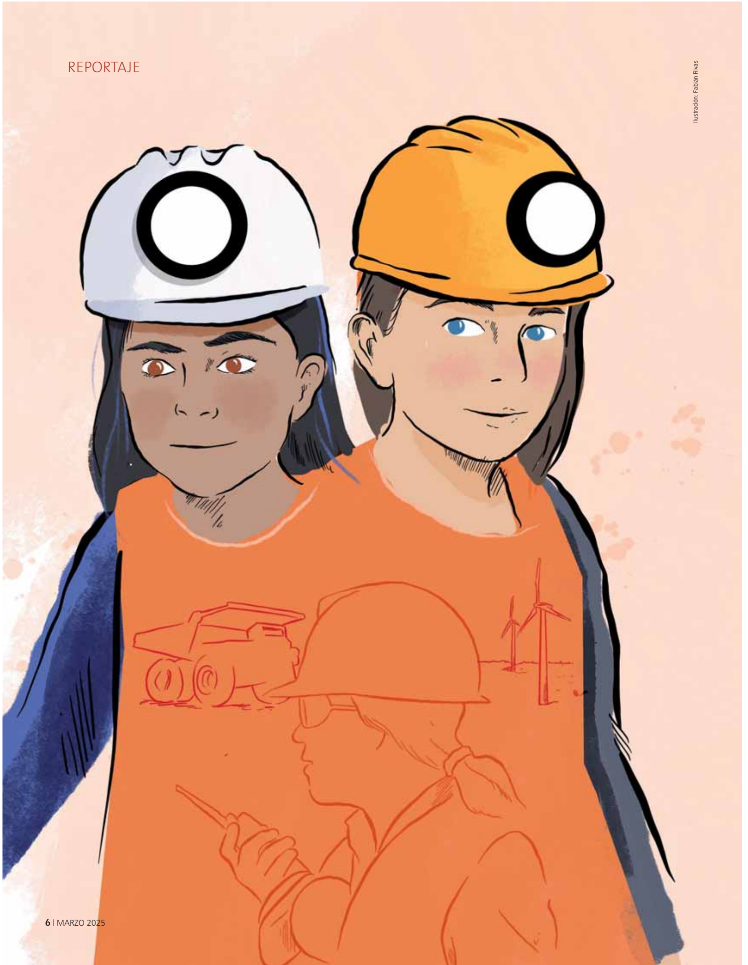
Ilustración: Fabián Rivas