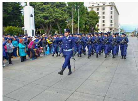
El tradicional desfile llamó la atención de turistas y vecinos que se acercaron a observar el evento.