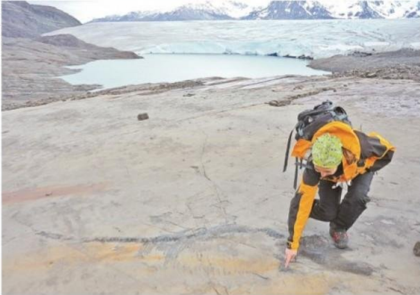
La zona del hallazgo del fósil en Torres del Paine.