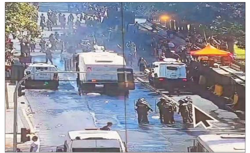
DESMANES.— Alrededor de 200 manifestantes cortaron el tránsito frente a la Biblioteca Nacional.

sonas mayores. Además, estas políticas deben asumir enfoques que aporten de forma ineludible a la equidad en la distribución de los cuidados en la vejez, y que contribuyan a eliminar la discriminación por edad en los diferentes ámbitos de la vida”.