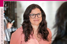
Antonia Orellana, ministra de la Mujer y la Equidad de Género.

pequeña propiedad raíz y se iniciaron obras en 12 caletas del país para dignificar los espacios en que se desempeñan las mujeres de la pesca y de actividades conexas. La Comisión Nacional de Riesgo (CNR) ha impulsado concursos exclusivos para mujeres agricultoras, lo que ha permitido que, este 2024, se lograra, por primera vez, que las mujeres igualaran a los hombres en cantidad de proyectos individuales bonificados. Pero también nos estamos haciendo cargo de un problema estructural. Y es que las tareas de cuidados, tan importantes para cualquier sociedad, recaen de manera desproporcionada sobre las mujeres. Por eso, en un trabajo liderado por la ministra del Trabajo, impulsamos y logramos aprobar la Ley de 40 Horas y de Conciliación de la Vida Personal, Laboral y Familiar. Y una de las prioridades para este año es consolidar el Sistema de Apoyos y Cuidados "Chile Cuida", con 100 Centros Comunitarios de Cuidados, la Red de Empresas Chile Cuida, una ley que lo