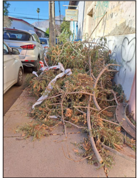
Primer grupo de ramas, viniendo desde Av. Chacabuco hacia Carlos Condell.

lidad de San Felipe, quien le señaló a una vecina que para el pasado lunes ambos serían despejadas de la vereda, cosa que no ocurrió. Es de esperar que este problema para los vecinos sea prontamente solucionado, ya que en las imágenes se puede apreciar claramente como se impide el libre tránsito peato- nal.