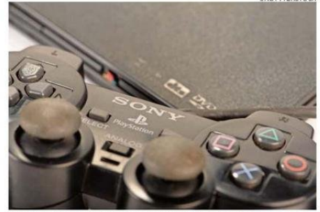
160 MILLONES DE UNIDADES SE HAN VENDIDO DESDE EL 2000.