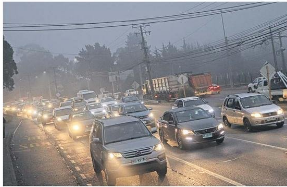
La congestión de vehículos particulares comenzó antes de las 7 de la mañana en la ruta 160 y Pedro Aguirre Cerda en San Pedro de la Paz.