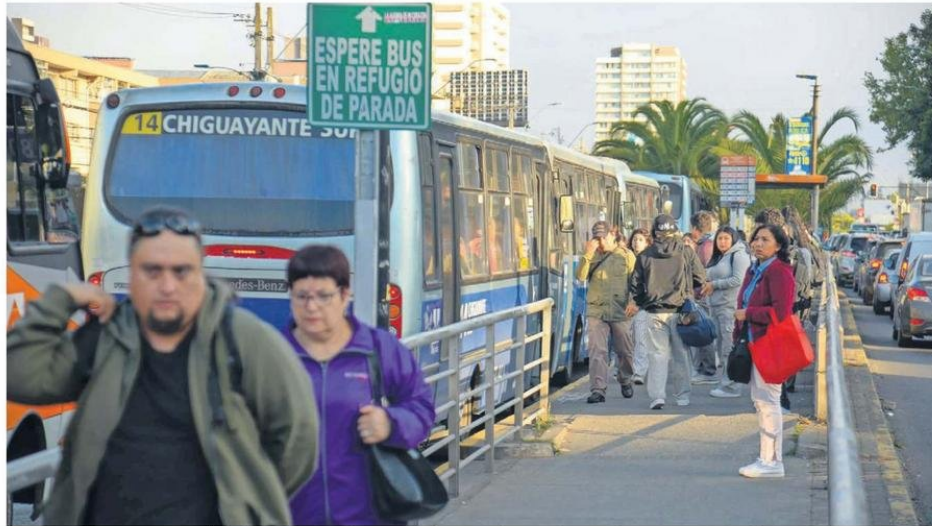
Pasajeros debieron esperar más de 20 minutos en algunos paraderos para lograr subir a un bus que no estuviera lleno.

Por su parte, el seremi de Transportes, Patricio Fierro, detalló que las exigencias al transporte público en cuanto a frecuencias (en el marco del perímetro de exclusión) alcanzó casi un 99% de