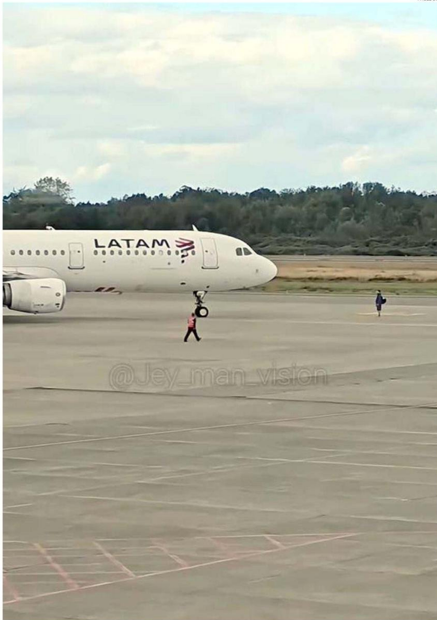
EN UN VIDEO QUE CIRCUILA EN REDES SOCIALES SE OBSERVA LA ACTITUD TEMERARIA DEL PASAJERO.

PUERTO MONTT. Un pasajero se atravesó delante de un avión que se preparaba para despegar hacia Concepción. Llegó a la losa, traspasando la sección donde arriban los pasajeros. Fue detenido por Carabineros y la Fiscalía dispuso de su libertad. Autoridades piden mejorar los sistemas de seguridad.