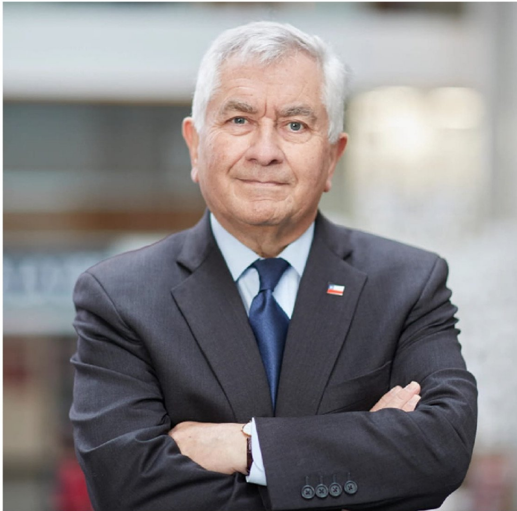
► El exministro de Salud de Sebastián Piñera, Enrique Paris, asumió la cartera 102 días después de la llegada del virus a Chile.