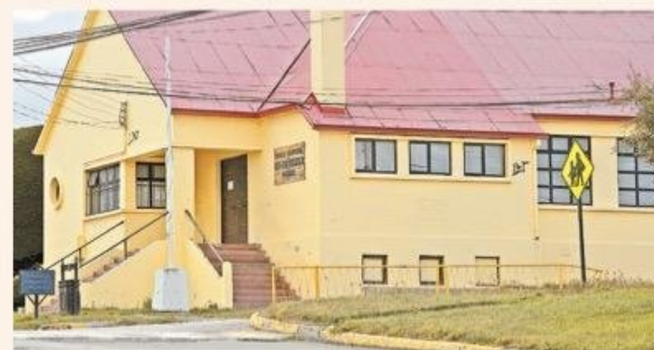
Desde mañana y hasta abril, la antigua y saturada Escuela Bernardo O'Higgins deberá albergar a cerca de mil alumnos, de enseñanza básica y media.

Cabe consignar que el horario normal en el liceo sería de 8 a 13 horas y de 14:30 a 17:45 horas, si estuvieran en su colegio con el proyecto de remodelación ya terminado. Además, la municipalidad tenía que haber iniciado una iniciativa similar en la Escuela Bernardo O'Higgins, pero tras dos licitaciones fallidas, los recursos pasaron a disposición de la Seremi de Educación, para que ésta los destine según lo estime conveniente. Esto ocurrió cuando un funcionario de la Dirección de Administración y Finanzas (Daf) del Slep se reunió con personal de la Secretaría de Planificación Comunal (Secplac), para tratar sobre un trato directo o hacer una nueva licitación, pero se le informó que el jefe de esa unidad empezaría sus vacaciones.