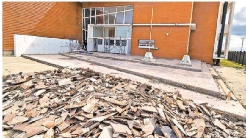
Esto es todo lo que los medios de comunicación pudieron obtener en fotografías sobre los trabajos en el plantel de enseñanza media, ya que personal municipal impidió el acceso a su interior, cuando ya se apreciaban atrasos en la cronología, iniciada en noviembre del año pasado.

turado de alumnos y que desde hace más de una década reclama por el hacinamiento que sufren, que incluso ha llevado