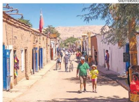
SAN PEDRO DE ATACAMA MARAVILLA POR SUS PAISAJES.

La aerolínea también compartió una de sus principales tendencias alcanzadas. “Entre diciembre de 2024 y febrero de 2025 proyectamos transportar 3,3 millones de pasajeros en Sudamérica. Tan solo en diciembre de 2024 transportamos 1,15 millones de pasajeros, lo que re-