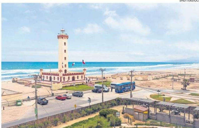
LA CAPITAL REGIONAL DE COQUIMBO OFRECE SUS EXTENSAS PLAYAS Y ATRACCIONES.

“Para satisfacer la alta demanda del verano, la compañía puso a disposición de sus pasajeros más de 142.373 vuelos, equiva-