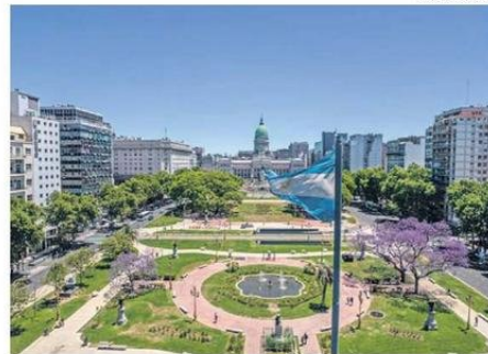
BUENOS AIRES DESTACA POR SU IDENTIDAD Y GASTRONOMÍA.

anotó un alza de 17,5% en comparación a la temporada anterior. En el tercer y cuarto lugar se posicionaron Iquique y Temuco. Los tickets a ambas ciudades experimentaron este año un aumento del 8,5% y 25%, respectivamente.