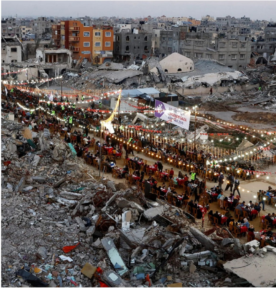
► Palestinos en Rafah, en el sur de la Franja de Gaza, 1 de marzo.