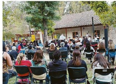
EXITOSO CONCIERTO DE LA ORQUESTA JUVENIL DE CALLE LARGA.

vergencia para actividades lúdicas y de aprendizaje, como charlas interactivas y actividades prácticas, diseñadas para involucrar a los asistentes en la exploración de la historia local.