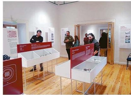
EXPOSICIÓN DE PERTENENCIAS DE PEDRO AGUIRRE CERDA.