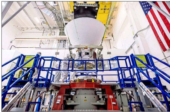
El telescopio SPHEREx mientras era testeado en las instalaciones de BAE Systems, en Colorado.

en la trayectoria de lanzamiento, pero se separarán y se centrarán cada una en su labor.