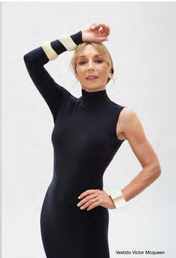
Vestido Victor Mcqueen

consciente de mis capacidades. Siempre, siempre, siempre. Muy consciente de mi carrera, de mi trayectoria, de mis habilidades, de mi versatilidad, de mi profesionalismo, de lo rigurosa y matea que he sido siempre.