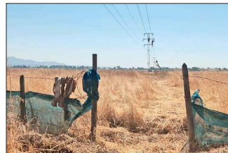
TALCA.— Un reciente robo de cables de alta tensión causó la interrupción del suministro eléctrico en seis comunas de la Región del Maule.

Este tipo de fallas en el Biobío afecta principalmente a sectores rurales, donde igualmente a intervalos pueden enfrentarse interrupciones en el servicio de electricidad por horas y hasta por días. Los apagones en zonas campestres incluso perjudican el funcionamiento de los sistemas de agua potable rural que operan con electricidad, interrumpiendo el suministro.