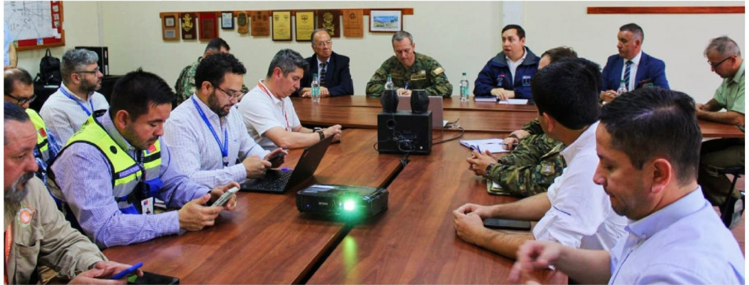
EL TRABAJO DEL COGRID PROVINCIAL permitió definir los principales puntos críticos por la emergencia.

Jorge Monares Olivares prensa@latribuna.cl