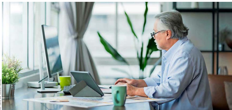
MUTUAL DE SEGURIDAD

+Senior busca fortalecer la inclusión generacional y facilitar la integración de trabajadores mayores.