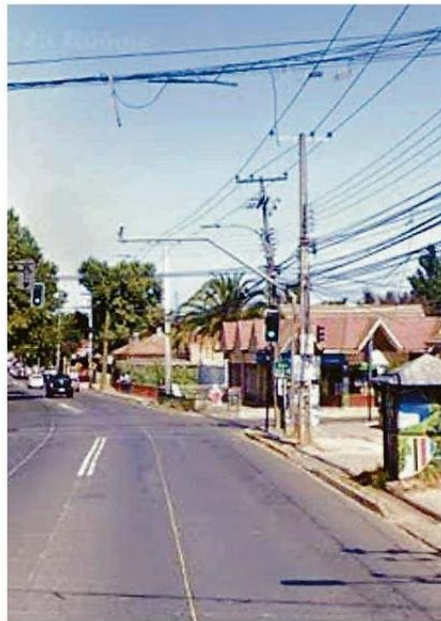
PACIENTE SIQUIÁTRICO VIVE EN SECTOR DE PUENTE NEGRO.