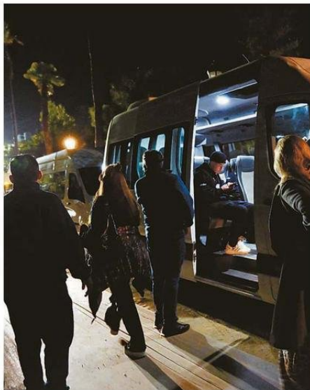
QUIENES ESTABAN EN LA QUINTA SE RETIRARON A OSCURAS Y CON ESCASA LOCOMOCIÓN.

Los organizadores agradecieron la flexibilidad de los artsitas para estar disponibles en esta nueva fecha y aclararon que decidieron no omitir