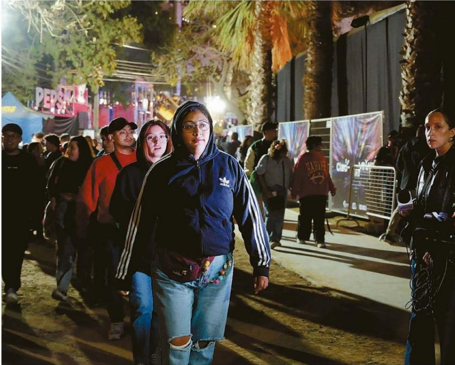
ANTES DE LAS 19.00 HORAS INGRESARON MILES DE PERSONAS A LA QUINTA, PERO A LAS 21.00 HORAS DEBIERON RETIRARSE.