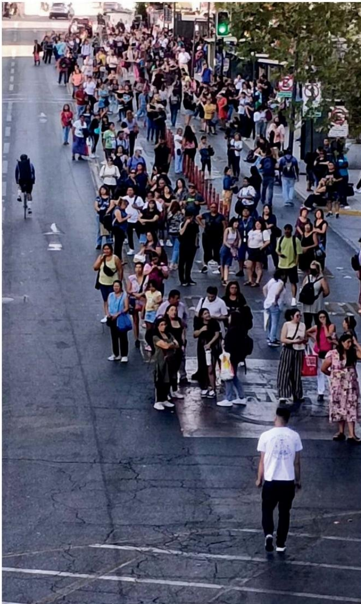
Millones de personas tuvieron que regresar caminando desde sus trabajos.

Nada más declararse la emergencia, el presidente de la República, Gabriel Boric, se desplazó a la Central de Gestión Operativa de Carabineros de Chile para monitorear la emergencia y luego sobrevoló en un helicóptero la capital, donde vive casi la mitad de la población del país, para