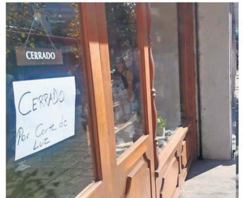
Algunos locales tuvieron que cerrar por el corte eléctrico.