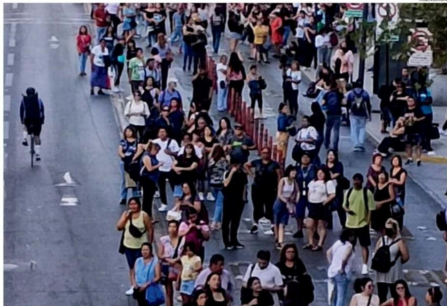
MILLONES DE PERSONAS TUVIERON QUE REGRESAR CAMINANDO DESDE SUS TRABAJOS.