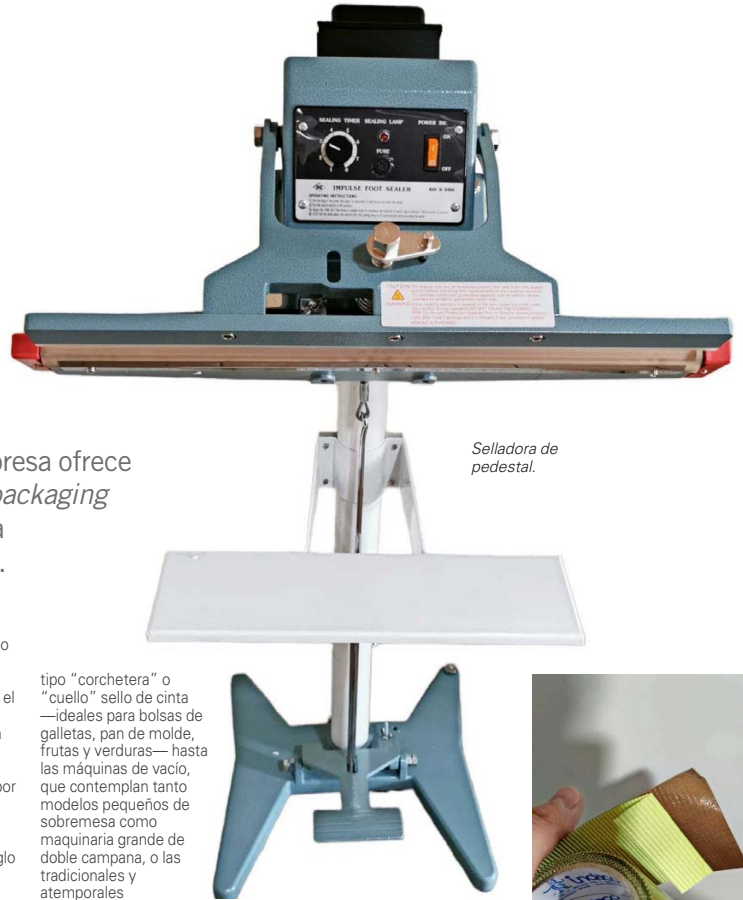
Selladora de pedestal.

En el corazón del negocio están también las máquinas selladoras, con una amplia variedad de modelos para distintas necesidades. Desde equipos portátiles y de sobremesa, como las selladoras