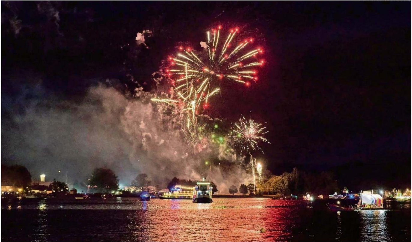
EL SHOW PIROTÉCNICO ESTÁ ANUNCIADO PARA LAS 23:30 HORAS Y TENDRÁ UN NUEVO PUNTO DE LANZAMIENTO DESDE EL MUSEO DE ARTE CONTEMPORÁNEO.

INCLUSIÓN. Por tercer año la Municipalidad de Valdivia dispondrá de condiciones especiales de cuidado e integración en el llamado Espacio de Accesibilidad Cognitiva y Apoyos Sensoriales . Se prevé que será usado por aproximadamente 500 personas.