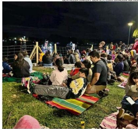
SE RECOMIENDA LLEVAR MANTAS, SNACKS Y LÍQUIDOS.