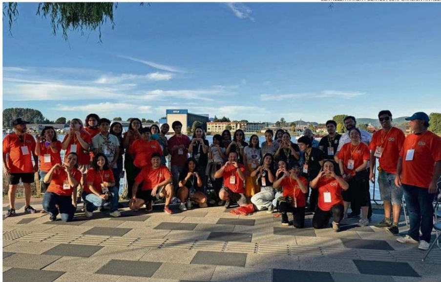
EL JUEVES POR LA TARDE SE REALIZARÁ UNA REUNIÓN INFORMATIVA EN EL MISMO LUGAR DONDE SE HABILITARÁ EL ESPACIO.

participaron el año pasado en la jornada de limpieza de la costanera de Valdivia convocada por Cervecería Kunstmann. Se recogieron cerca de 250 kilos de desechos.