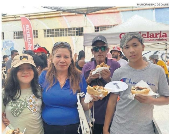
FAMILIAS DE CALDERA, LA REGIÓN Y EL PAÍS ASISTIERON A LAS DIVERAS ACTIVIDADES DE ESTOS DÍAS.

En tanto, en la categoría familiar los lugares fueron los siguientes: tercer lugar para la familia Araya Alfaro con la creación de un cachalote comiendo calamar; segundo lugar la familia Carmona Araya con el