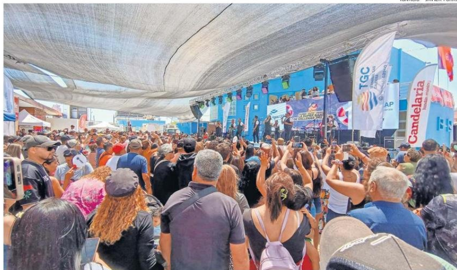
UNA MASIVA CONCURRENCIA TUVO EL CHAO PESCA'O 2025, QUE REUNIÓ A VECINOS Y TURISTAS QUE LLEGARON A DISFRUTAR PRODUCTOS MARINOS

En esta ocasión fueron unas 15 presas de pescado que frieron y lo entregaron