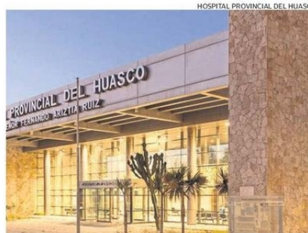
EL CASO MÁS ANTIGUO ESPERA ATENCIÓN EN EL HOSPITAL PROVINCIAL.

Cabe señalar que también los equipos de salud están trabajando en la gran cantidad de horas médicas que se pierden por la inasistencia de los pacientes y que retrasan el sistema. El número de insistencias en Hospitales de Vallenar y Copiapó de enero a diciembre de 2024 fue de 16.888 consultas.