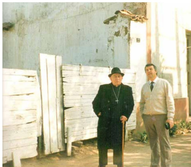
El oriundo de Villa Alegre con el cardenal Raúl Silva Henríquez, con quien tuvo larga amistad.

“Si yo hago una estatua con un O’Higgins vestido con un uniforme que nunca usó, estoy falseando una verdad histórica”.