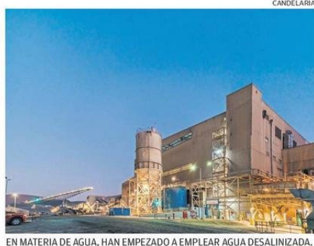
EN MATERIA DE AGUA, HAN EMPEZADO A EMPLEAR AGUA DESALINIZADA.