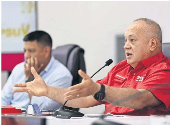
CABELLO SE REFIRIÓ TAMBIÉN A LAS RELACIONES CON CHILE.

Luego dijo "no le voy a responder. (...) No han podido encontrar a los asesinos, si ellos jorungan (hurgan) van a encontrar a los asesinos facilito".