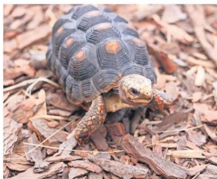
"SELVA VIVA" ESTÁ UBICADA EN EL VIVERO MUNICIPAL DE CHAÑARAL.