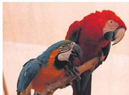
EL SÁBADO 22 DE FEBRERO HABRÁ UN BUS DE ACERCAMIENTO EN EL SALADO.