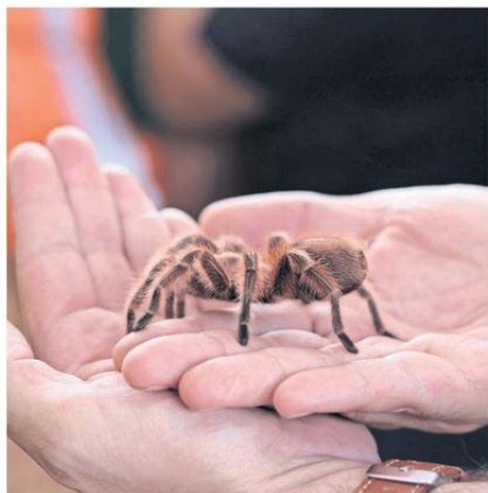
GRANDES Y CHICOS PODRÁN DISFRUTAR DE LA EXHIBICIÓN NATURAL.