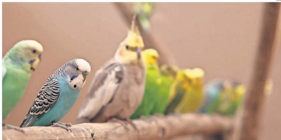
LA EXHIBICIÓN "SELVA VIVA" ES ITINERANTE Y RECORRE CADA RINCÓN DEL PAÍS. EN ESTA OCASIÓN, FUE EL TURNO DE LA COMUNA PUERTO DE CHAÑARAL.