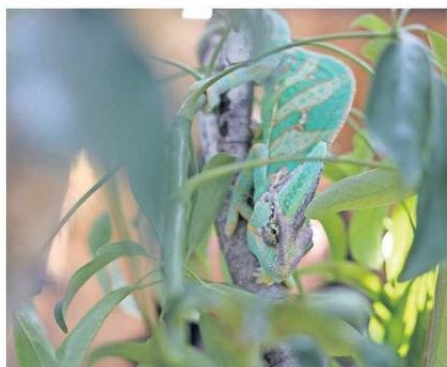
LA MUESTRA ESTARÁ DISPONIBLE HASTA EL DÍA 24 DE FEBRERO.