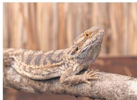
LA COMUNIDAD CHAÑARINA QUEDA INVITADA A DISFRUTAR DE LA ACTIVIDAD.