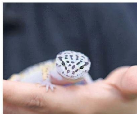
LOS HORARIOS DE LA MUESTRA SE EXTIENDEN DE 112 A 18 HORAS.