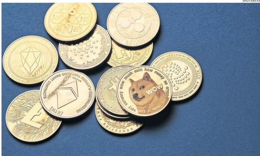
LAS MEMECOINS, COMO TAMBIÉN SON DENOMINADAS, ESTÁN INSPIRADAS EN MEMES O PERSONAS Y PERSONAJES POPULARES.

“Las criptomonedas memes se les llama así por-