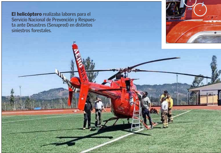
El helicóptero realizaba labores para el Servicio Nacional de Prevención y Respuesta ante Desastres (Senapred) en distintos siniestros forestales.

Desde el Ejecutivo han señalado que, por ahora, los antecedentes encajarían con la norma de Seguridad del Estado. Sin embargo, entre expertos hacen llamado a que sea la fiscalía la que discrimine.