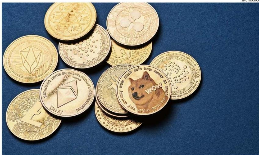
LAS MEMECOINS, COMO TAMBIÉN SON DENOMINADAS, ESTÁN INSPIRADAS EN MEMES O PERSONAS Y PERSONAJES POPULARES.

“Las criptomonedas memes se les llama así porque están inspiradas en me-