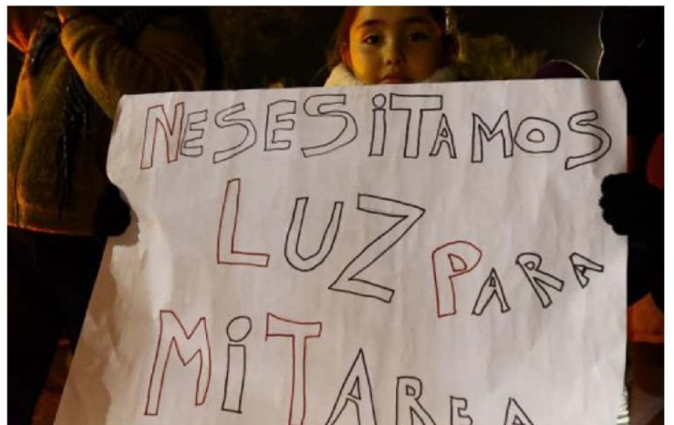
LAS INTERRUPCIONES DEL SERVICIO BIOBÍO generaron problemas, desde la pérdida de alimentos y medicamentos hasta la quema de electrodomésticos.