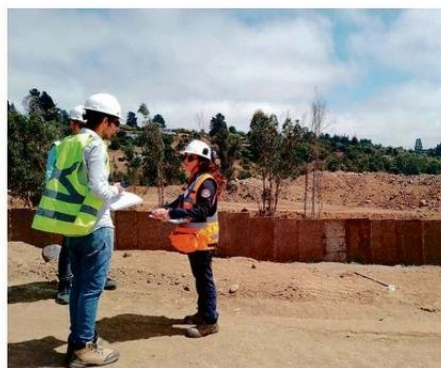
LOS VECINOS DENUNCIARON LOS HECHOS A LA SMA.