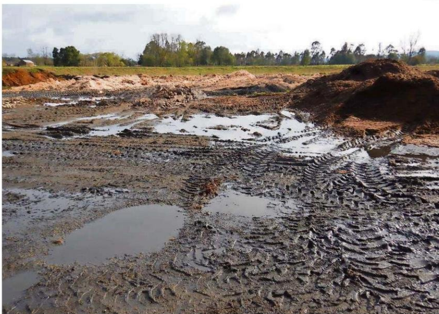
UNO DE LOS OBJETIVOS DE LA INICIATIVA ES REGULAR LA TRAZABILIDAD DE LOS ÁRIDOS, CUALQUIERA SEA SU ORIGEN.

Sobre las consecuencias de esto, indicó que los retrasos en