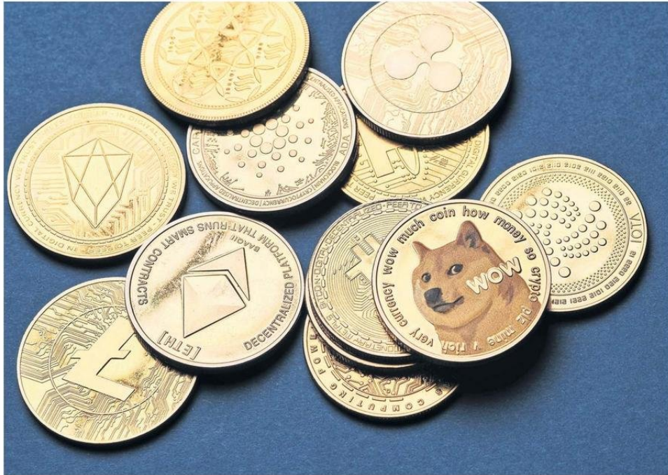
Las memecoins, como también son denominadas, están inspiradas en memes o personas y personajes.

tina pertenece al universo de los activos digitales diseñados para generar dinero a su creador utilizando la imagen de una figura pública y la credulidad de sus seguidores. Ante la falta de regulación, ofertas de este tipo tiene más similitudes con un esquema Ponzi (estafa de tipo piramidal) que con un activo financiero legítimo.