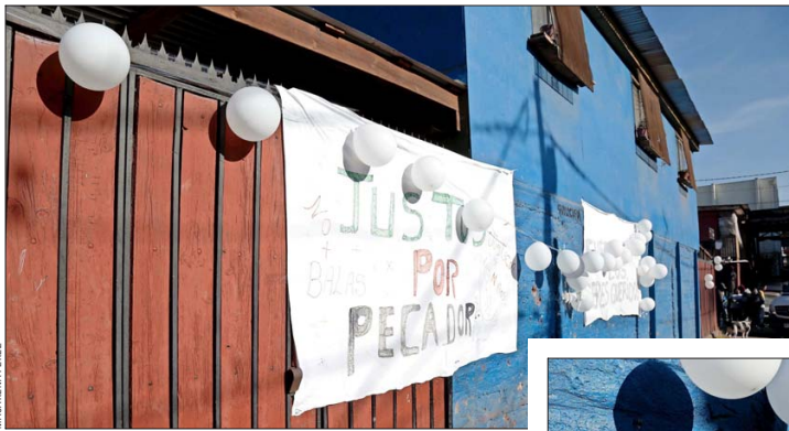
BALACERA.— A mediados del año pasado murieron cuatro adolescentes, de entre 13 y 16 años, durante una balacera en Quilicura.

Se trata de cifras que preocupan, porque el alza se mantiene en el tiempo, según datos del Ministerio Público. Los casos pasaron de 244 a 351 en los períodos analizados.