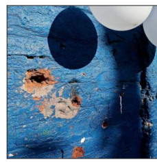
El impacto de una bala cerca de donde se produjo el tiroteo.

Sobre este último punto, Sánchez también hace énfasis en que “el Estado no ha sido capaz de llegar oportunamente a mitigar estos factores de riesgo con una oferta completa, de carácter preventivo”.