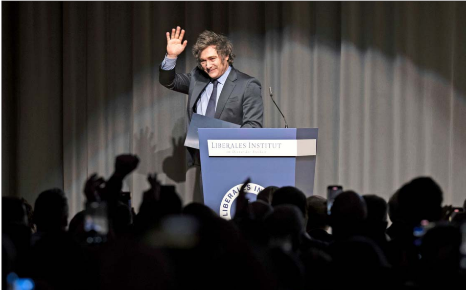
MILEI DIJO que es "tecnoprimista fanático", pero reconoció sus limitaciones: "Yo no sé nada de criptomonedas", admitió.

Milei está en el centro de la polémica del caso "Criptogate", luego que el viernes publicara en la red social X un mensaje en el que promovió la nueva criptomoneda $LIBRA, que presuntamente serviría para financiar a pequeñas empresas argentinas y cuyo link derivaba al dominio vivalibertadproject.com. El Presidente escribió su tuit apenas tres minutos después de que se creara el token digital, cuya cotización pasó rápidamente de US$ 0,000001 a US$ 5,2, lo que significaba una capitalización bursátil de unos US$ 4.500 millones. Pero la sospecha se instaló porque el 82% del circulante estaba concentrado en solo cinco billeteras digitales. Y en medio de rumores de que se trataba de una "memecoin" —una criptomoneda inspirada en memes o en bromas— y de que parecía un esquema de "pump and dump" —una estrategia de manipulación en la que