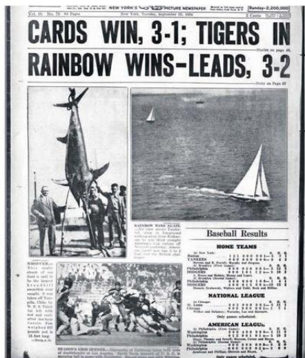
PORTADA DEL DAILY NEWS DONDE SE MUESTRA QUE LA PESCA DEPORTIVA DE PECES ESPADA ERA MUY APRECIADA INTERNACIONALMENTE, NO ASÍ EN NUESTRO PAÍS.

espada y el marlín, y de cómo varias mujeres ayudaron a reescribir las reglas de un deporte dominado por hombres.