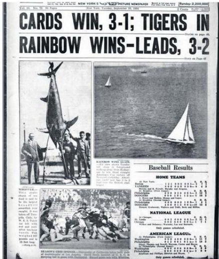
PORTADA DEL DAILY NEWS DONDE SE MUESTRA QUE LA PESCA DEPORTIVA DE PECES ESPADA ERA MUY APRECIADA INTERNACIONALMENTE, NO ASÍ EN NUESTRO PAÍS.

espada y el marlín, y de cómo varias mujeres ayudaron a reescribir las reglas de un deporte dominado por hombres.