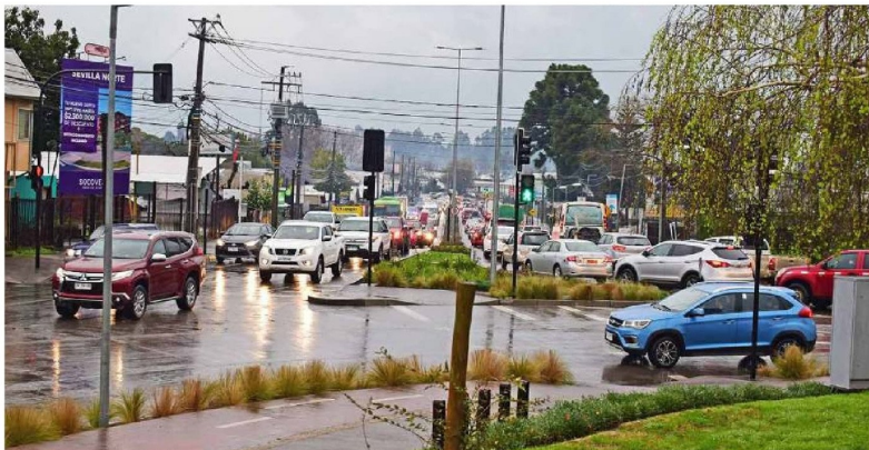
EL INICIO DE CLASES hace prever que habrán congestiones en las horas peak.

Lo anterior, considerando -entre otras obras- el despeje y la limpieza en la faja vial, la conservación de pavimentos por medio de mezcla y bacheos asfálticos, el reperfilado frecuente en caminos sin pavimentar, la conservación de puentes de madera, la construcción de alcantarillas para el saneamiento de caminos, la mantención y el mejoramiento de elementos de señalización vertical y demarcación vial, además de operaciones de emergencia que permiten disponer de maquinaria y material para la mejora y rehabilitación de caminos en casos especiales.