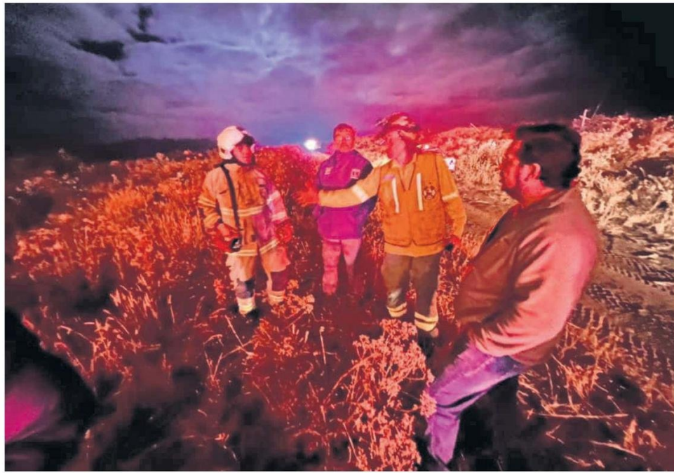
Parte de los múltiples incendios han ocurrido por la noche.

“Lo que estamos haciendo es parecido a lo que hicimos en el ataque frontal al robo de madera; mapear los lugares donde ocurre el ilícito, la forma en que se genera, los días y horarios probables en que se desarrollan, y donde están generando-se la venta de esos productos”