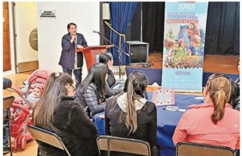
En una charla a estudiantes de Pedagogía de la Umag.