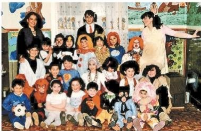
El inicio del jardín del Colegio Miguel de Cervantes

Convencer a los padres fue una tarea ardua. Para ello, se realizaron actividades demostrativas con materiales básicos, como masas para modelar, y se mostró cómo los niños podían desarrollar