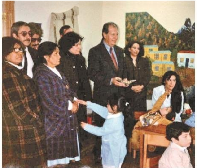
La inauguración de los Jardines Familiares Étnicos, en Puerto Williams, fueron los primeros de Chile y se contó con la presencia del entonces ministro de Educación Ricardo Lagos.

El modelo magallánico de educación preescolar en zonas aisladas fue un referente que inspiró a otras regiones de Chile y países latinoamericanos. Representantes de Nica-