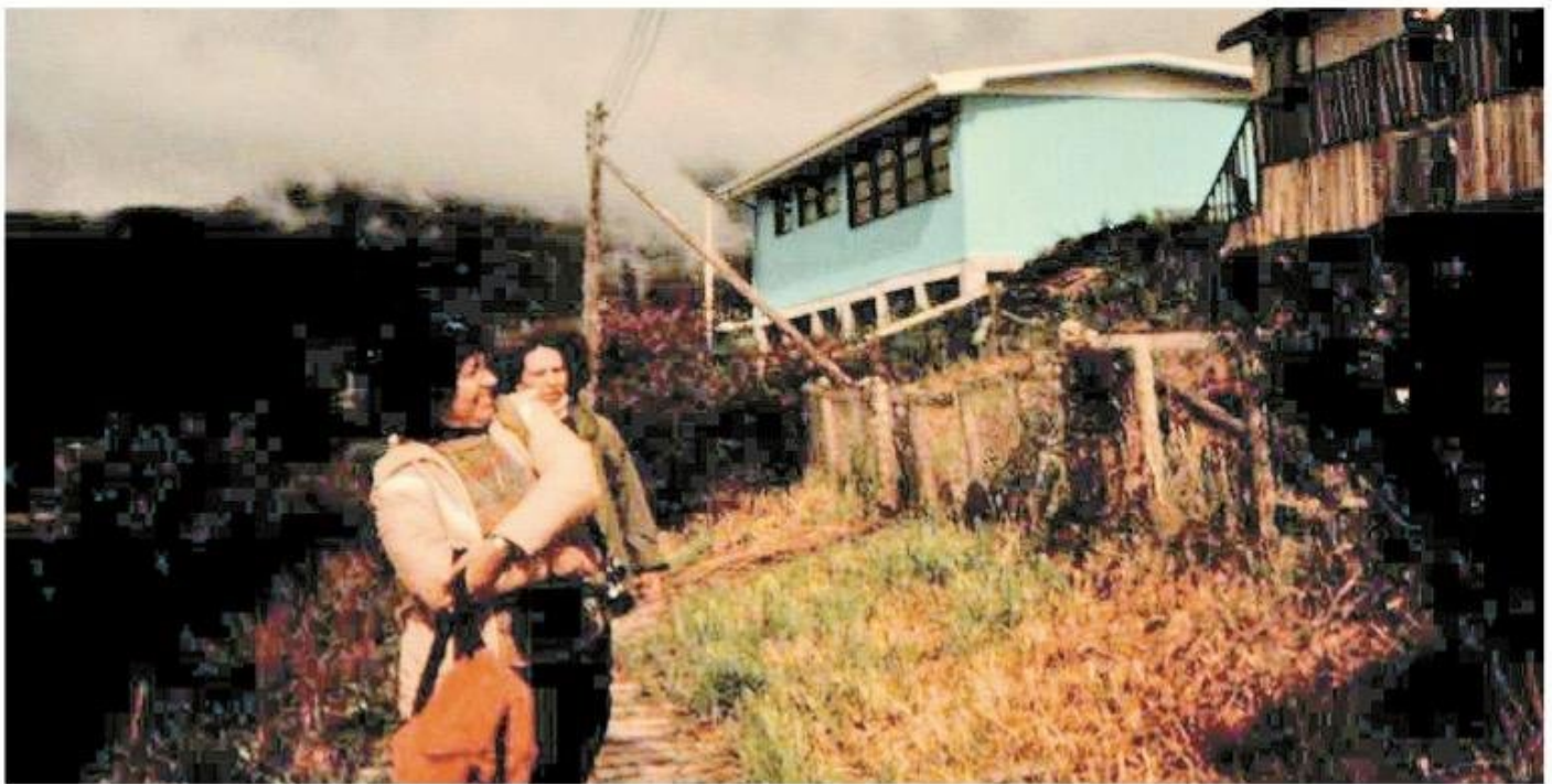
La travesía para llegar a Puerto Edén era una aventura en sí misma.