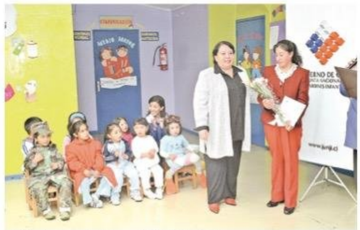
Participando de una actividad en un jardín infantil en 2006.