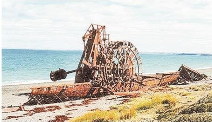
Los restos del Olympian en la playa de Posesión.

La proa con el bauprés y un tramo de la quilla son sus únicos restos.