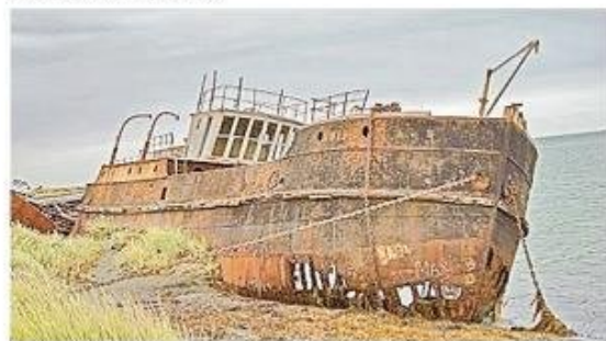
Lo que queda del Amadeo yace hoy en la playa de San Gregorio.