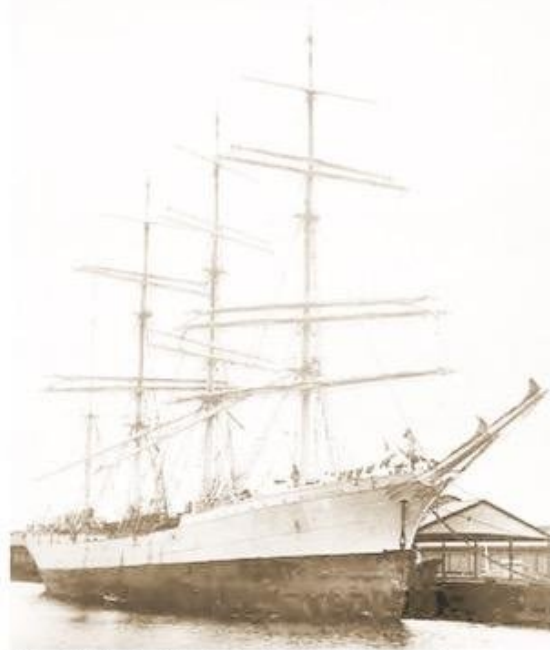
El bergantín Andalucía fue botado al agua en 1899, en Francia.

Al parecer autoridades civiles y navales de la zona magallánica, quisieron implementar alguna iniciativa para convertir el buque en museo, reliquia o atracción turística, pero con las convulsiones po-