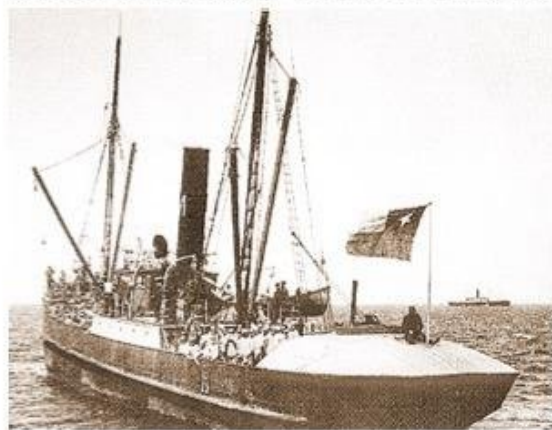
El Amadeo fue el primer barco a vapor inscrito en los registros navales de Punta Arenas el año 1893.

Esta embarcación a vela medía 53,54 metros de eslora, 9,54 de manga y 5,82 de puntal y su capacidad de carga era de 714 toneladas. Su mascarón de proa mostraba un diplomático del siglo XVIII en su vistoso