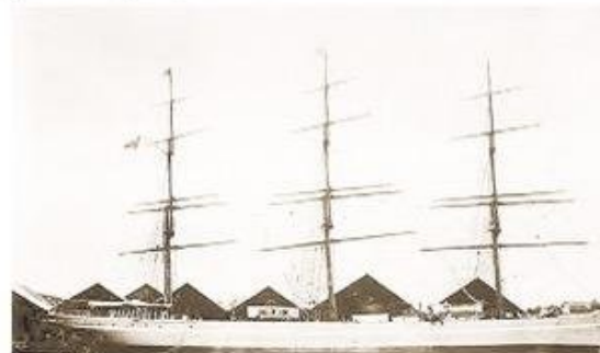
El barco de casco de acero Lonsdale fue comprado a inicios del siglo pasado por la firma Braun & Blanchard para ser usado como pontón lanero.