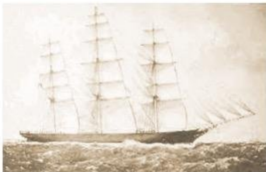
La embarcación a vela Ambassador fue una de las famosas y veloces naves que cubrían la ruta de la llamada "Carrera del té".

atuando, primer buque a vapor que llegó a Punta Arenas. Este barco de construcción "composite", es decir, casco con cuadernas de hierro y forrado en madera de teca es uno de los famosos y veloces "Tea Clippers" que cubrían la ruta entre los puertos chinos de Cantón, Shangai y Londres alrededor de 1872. Junto a su similar, el famoso Cutty Sark, exhibido como museo en Greenwich, Inglaterra, representa uno de los últimos Clippers de la "Carrera del té".