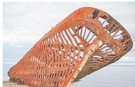
Hoy la oxidada estructura del Ambassador reposa en la playa de San Gregorio.

te temporal había cortado las amarras del Olympian, quedando al garete. La Armada ordenó el zarpe de la escampavía Huemul para acudir en su auxilio, pero la fuerte marejada impidió la ayuda efectiva, encallando el vapor en las playas de la bahía Posesión el 16 de marzo. Posteriormente, contando con la cooperación del vapor regional Keel Row, el Huemul logró reflotar al Olympian el 9 de abril, sin