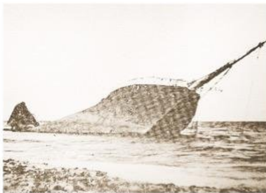
Los restos del Andalucía en las playas fueguinas.

Este buque fue botado el 27 de abril de 1899, en Francia,