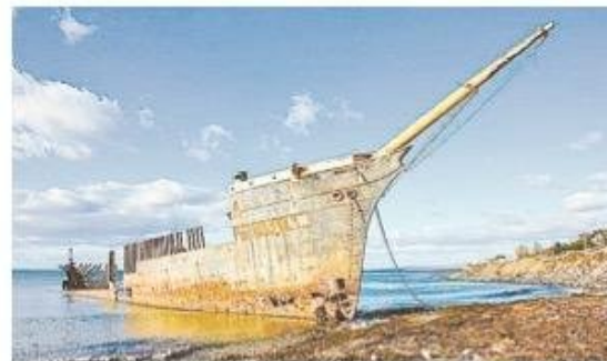
Los restos de la fragata Lonsdale, frente al Parque María Behety, fueron declarados Monumento Histórico en 1974.