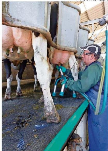
PRENSA APROVAL LECHE

De acuerdo a los antecedentes proporcionados, la cooperativa Colun procesó casi el 90% de la leche recepcionada en Los Ríos, consolidando su