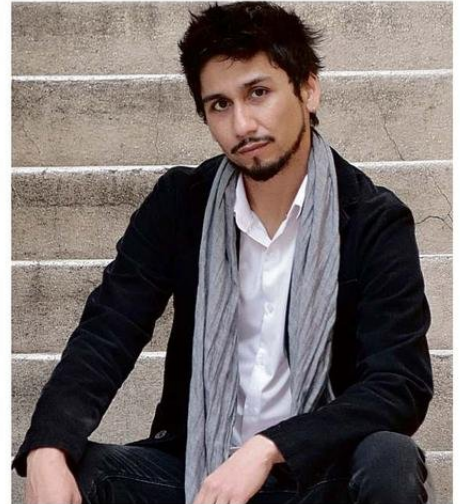
CHILENIDADES EN EL SIGLO XXI (2025).