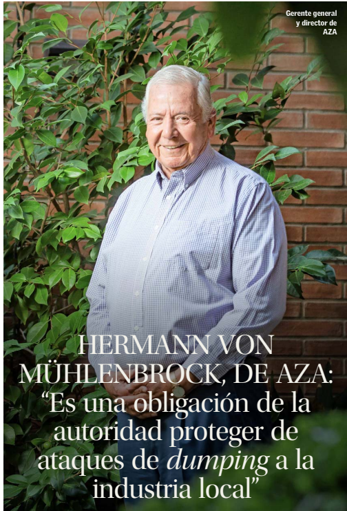
Gerente general y director de AZA

El histórico ejecutivo minero sostiene que no hay fundamentos para que el gobierno de Trump aplique aranceles al cobre. No tiene la capacidad para generar la cantidad que necesita, ni tampoco inversiones para sustentarla, indica. “Estamos en una situación más segura”, dice. Pese a ello, llama a la cautela. B 6